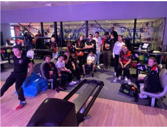
Accueil des stagiaires.