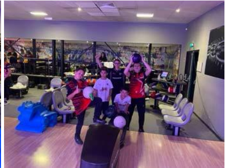
Constitution des groupes de travail.