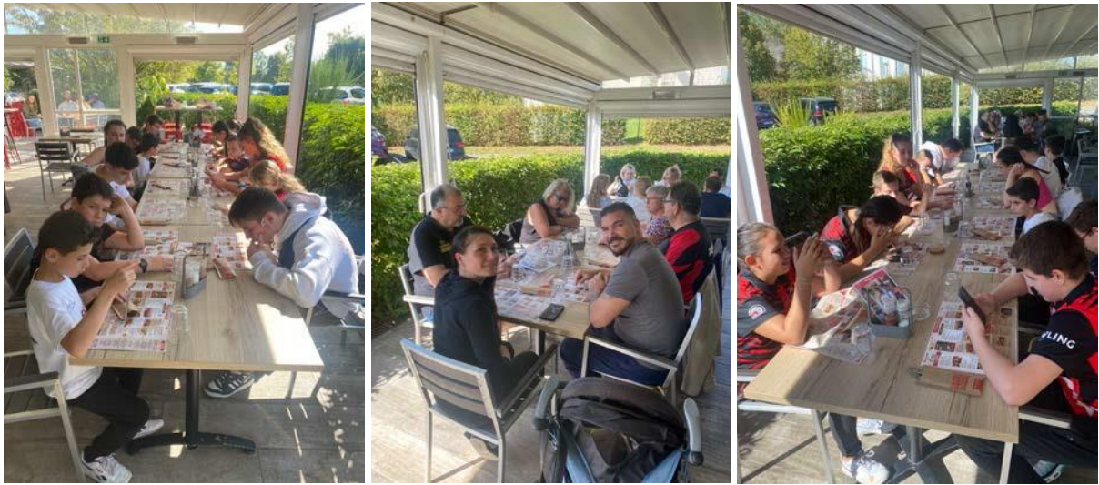
Pause déjeuner des stagiaires, animateurs et accompagnateurs.

L'équipe ERJ remercie les parents et accompagnateurs et vous donne rendez-vous le 17 décembre 2023 pour la deuxième journée.